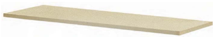
SLH 1008 B Estante forrado. 50 x 54 x 2 cm.