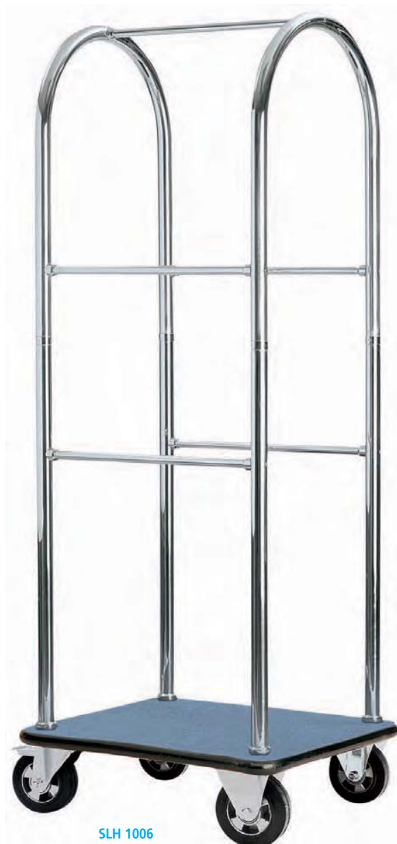
SLH 1006 Carro servicio en latón cromado. 70 x 60 x 182 cm.