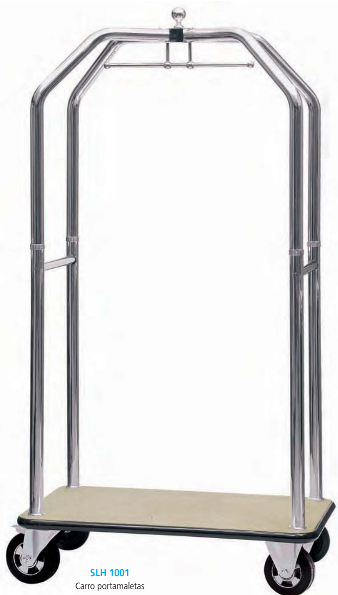
SLH 1001 Carro portamaletas en latón cromado. 98 x 60 x 190 cm.