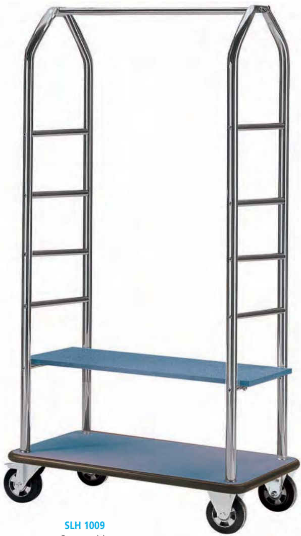
SLH 1009 Carro servicio en latón cromado. 70 x 60 x 182 cm.