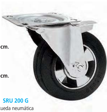
SRU 160 G Rueda carro \varnothing 16 cm. Con freno.