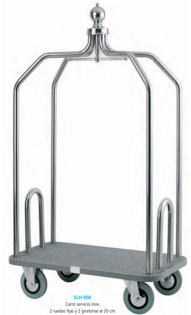
SLH 900 Carro servicio inox. 2 ruedas fijas y 2 giratorias \varnothing 20 cm. 112 x 62 x 190 cm.