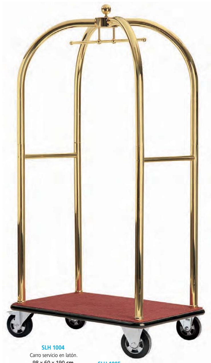
SLH 1004 Carro servicio en latón. 98 x 60 x 190 cm.