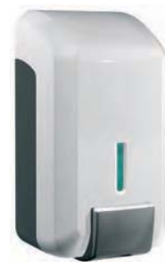
SJV 479 Dispensador jabón. Compatible hidroalcohólico. Capacidad: 800 ml. 11 x 10 x 21 cm.