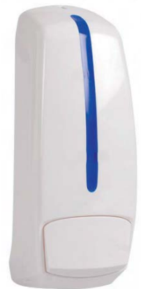
AC 95000 Dosificador carga higienizante. Plástico ABS blanco/azul. Capacidad: 0,800 litros.