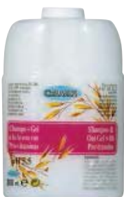
SCR 010-21 Cartucho rellenable. Champú + gel Avena.