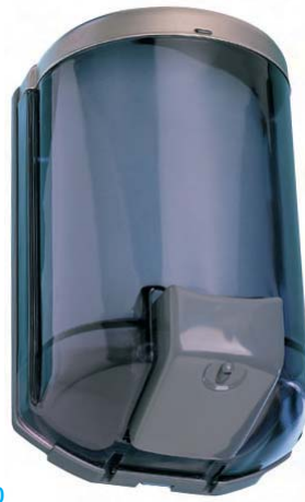
AC 71000 Dosificador de jabón. Plástico ABS FUMÉ. Capacidad: 0.900 ml. 13 x 9,5 x 22 cm.