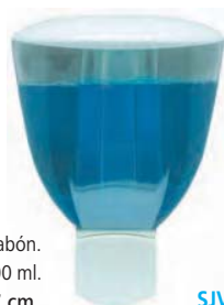
SJV 297 Dispensador jabón. Capacidad: 800 ml. 13 x 10 x 17 cm.