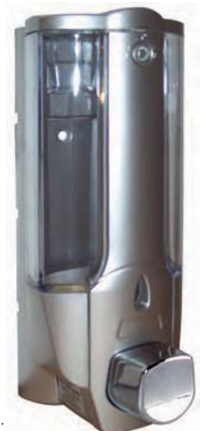
AC 702 Dosificador plata. Plástico ABS. Capacidad: 400 c.c.