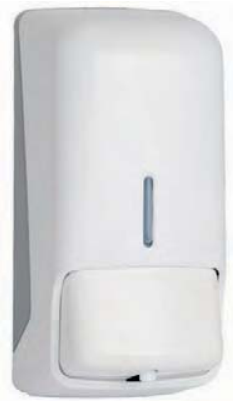
AC 40000 Dosificador de espuma. Plástico blanco ABS. Capacidad: 0,800 litros.