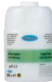
SCR 010-24 Cartucho rellenable. Jabón con glicerina.