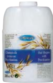
SCR 010-22 Cartucho rellenable. Champú avena.