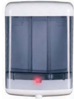
AC 90000 Dosificador de jabón automático. Plástico fumé ABS. Capacidad: 1 litro.