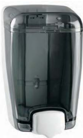
AC 82000 Dosificador de jabón. Plástico FUMÉ. Transparente. Base y pulsador blanco. Capacidad: 1.000 ml. 12 x 11,5 x 20,5 cm.