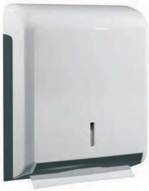
SJV 604 Dispensador ABS blanco. Capacidad: de 400 a 600 toallas. 27 x 11 x 34 cm.