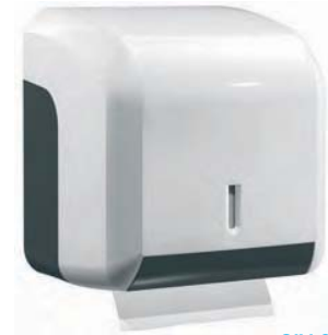
SJV 608 DUO Portarrollos ABS blanco. 200 hojas o 1 rollo higiénico doméstico. 14 x 12 x 15 cm.