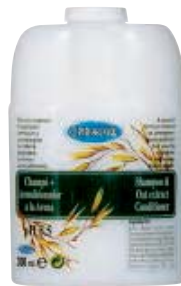
SCR 010-25 Cartucho rellenable. Champú + acondicionador avena.