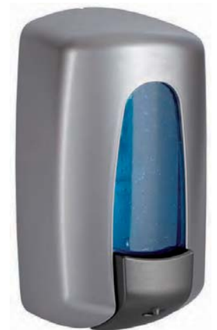
AC 72000 Dosificador de jabón. Plástico ABS metalizado. Capacidad: 1.000 ml.