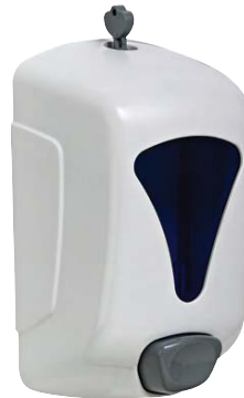
SEM8510200 Dosificador de gel. Plástico ABS blanco con visor. Capacidad: 0,35 litros. 13,2 x 8,5 x 21 cm.