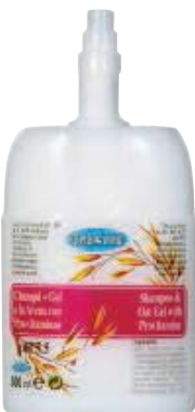
SCR 010-31 Cartucho desechable. Champú + gel Avena.