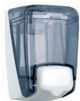
AC 84000 Dosificador de jabón. Plástico FUMÉ. Transparente. Base y pulsador blanco. Capacidad: 0,400 c.c. 11,5 x 82 x 13,5 cm.