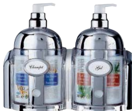
SCR 352-10 Dosificador de jabón. Rellenable. Capacidad: 300 c.c.