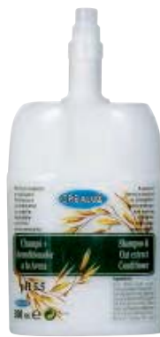
SCR 010-35 Cartucho desechable. Champú + acondicionador avena.