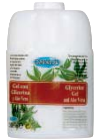
SCR 010-23 Cartucho rellenable. Gel con glicerina y Aloe Vera.