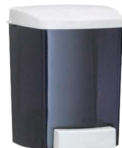
SMDS 30 TBL Dosificador de jabón. Plástico FUMÉ. Capacidad: 0,900 c.c.