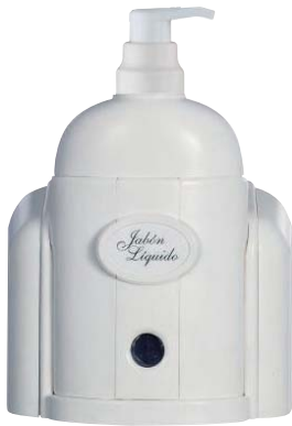
SCR 551-01 Dosificador de jabón. Rellenable. Capacidad: 300 c.c.