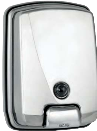
AC 54500 Inox brillo. Depósito: 1.000 ml.