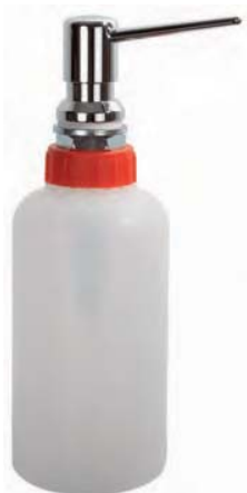
AC 900 Dosificador. Capacidad: 400 c.c.