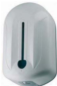
SJV 397 Dispensador jabón. Automático Capacidad: 1100 ml. 14 x 11 x 24 cm.