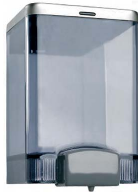
AC 21150 Dosificador de jabón. Plástico FUMÉ. Tapa acero inoxidable. Capacidad: 1,4 litros. 11 x 13 x 20,5 cm.