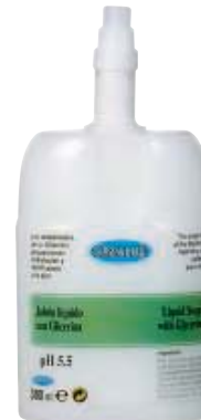
SCR 010-34 Cartucho desechable. Jabón con glicerina.