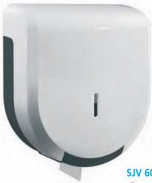
SJV 602 Portarrollos ABS blanco. Capacidad: bobina ø 24 cm. 25 x 12 x 28 cm.