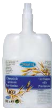
SCR 010-32 Cartucho desechable. Champú avena.