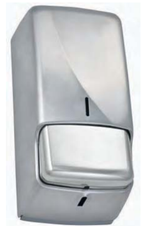
AC 53500 Dosificador de jabón de carga . Inox brillo.