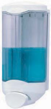
SJV 102 Dispensador jabón. Capacidad: 1000 ml. 11 x 25 cm.