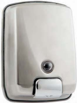
AC 54000 Inox satinado. Depósito: 1.000 ml.