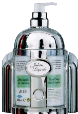
SCR 351-10 Dosificador de jabón. Para cartucho rellenable. Capacidad: 300 c.c.