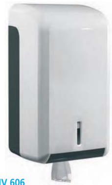
SJV 606 Dispensador ABS blanco. Capacidad: bobina ø 13 cm. 15 x 14 x 28 cm.