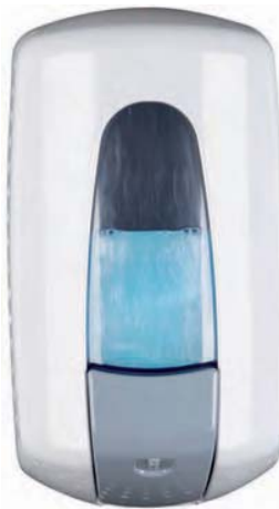
AC 70000 Dosificador de jabón. Plástico ABS blanco. Capacidad: 1.000 ml. 13 x 9,5 x 22 cm.