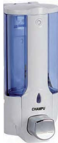
AC 800 Dosificador blanco/gris. Plástico ABS. Capacidad: 400 c.c. DOBLE