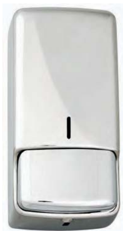
AC 45500 Dosificador de espuma. Inox brillo. Depósito: 0'800 ml.