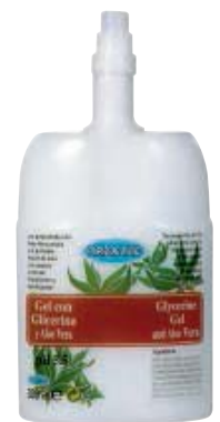
SCR 010-33 Cartucho desechable. Gel con glicerina y Aloe Vera.