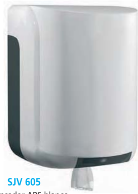
SJV 605 Dispensador ABS blanco. Capacidad: bobina ø 20 cm. 22 x 22 x 31 cm.