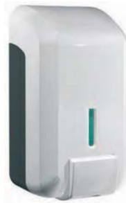
SJV 478 Dispensador jabón espuma. Capacidad: 800 ml. 11 x 10 x 21 cm.