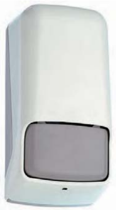
AC 80050 Dosificador carga de jabón. Plástico ABS. Capacidad: 0'850 litro. 13 x 9,5 x 22 cm.