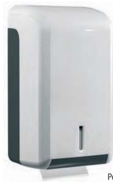
SJV 607 DUO Portarrollos ABS blanco. 600 hojas o 2 rollos higiénico doméstico. 15 x 14 x 28 cm.