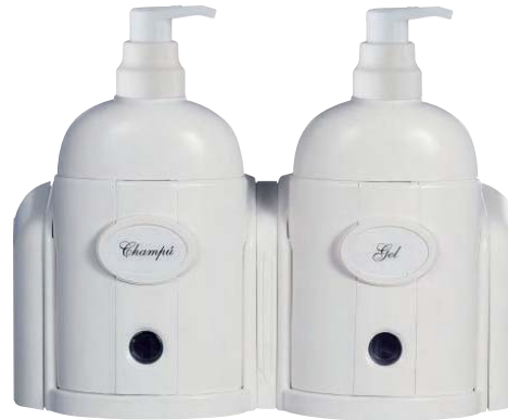
SCR 552-01 Dosificador de jabón. Para cartucho rellenable. Capacidad: 300 c.c.