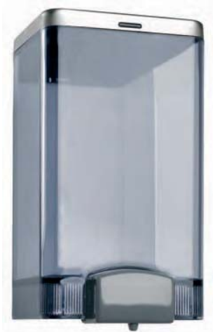
AC 22000 Dosificador de jabón. Plástico FUMÉ. Tapa acero inoxidable. Capacidad: 2 litros. 11 x 13 x 23 cm.