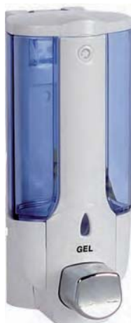
AC 802 Dosificador plata. Plástico ABS. Capacidad: 400 c.c. DOBLE