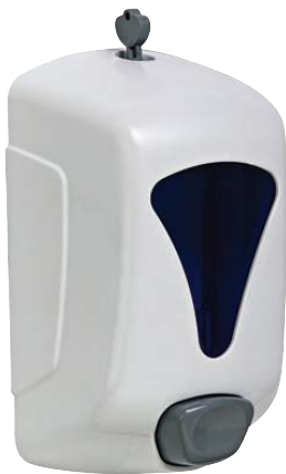
SEM8510100 Dosificador de gel. Plástico ABS blanco con visor. Capacidad: 0,9 litros. 13,2 x 8,5 x 21 cm.