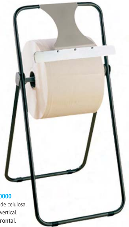
AD 30000 Portabobina de celulosa. Modelo vertical. Sierra frontal. 40,5 x 46 x 84 cm.