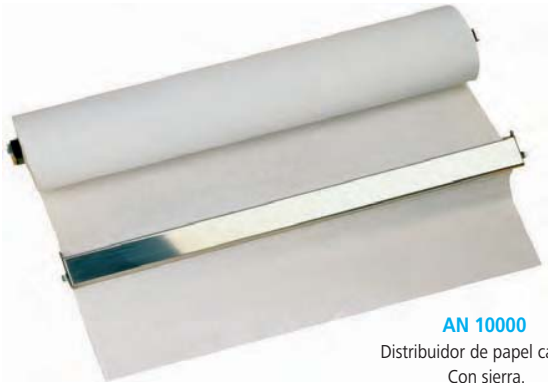
AN 10000 Distribuidor de papel camilla. Con sierra. Rollo: ø 12 cm x 59 cm.