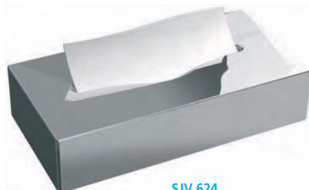
SJV 624 Dispensador pañuelos. Inox brillo. 28 x 14 x 6 cm.