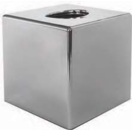
SCEK 12 A Dispensador pañuelos. Cromado. 13,5 x 13,5 x 13 cm.