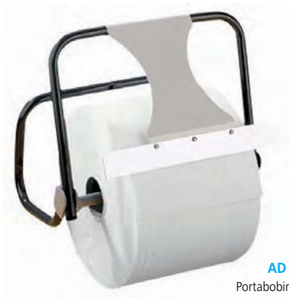
AD 10000 Portabobina de celulosa. Modelo mural. Sierra frontal. 40,5 x 26,5 x 37,5 cm.