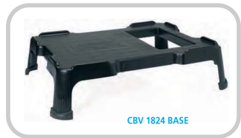
CBV 1824 BASE