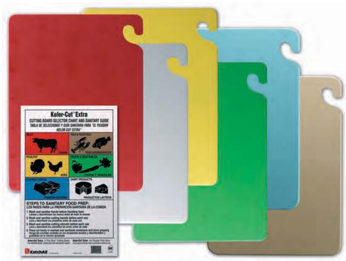
TAMAÑO GRANDE 32,5 X 53 X 1,5 cm.

Tabla de cortar. Evita contaminación cruzada. Resistentes al lavavajillas. Varios colores.