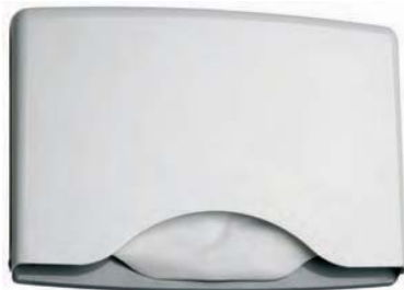
AM 21000 Distribuidor de papel. Cubre-asientos W.C. 42 x 4 x 31 cm.