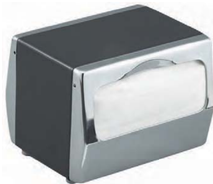
SMDH4001BKC Maxi-service de sobremesa. Boca transparente. Capacidad: 170 servicios. 19,7 x 14,6 x 12,5 cm.