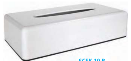
SCEK 10 B Dispensador pañuelos. ABS. 26 x 14 x 6 cm.