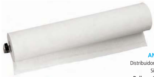
AN 20000 Distribuidor de papel camilla. Sin sierra. Rollo: ø 12 cm x 59 cm.