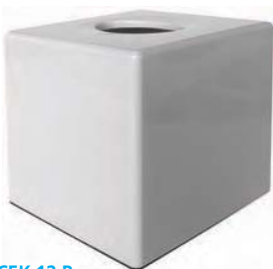
SCEK 12 B Dispensador pañuelos. ABS. 13,5 x 13,5 x 13 cm.