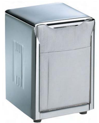
SMDH985X Miniservice. Acero inoxidable.