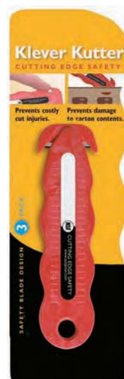
SMDKK403 Cutter desechable. Previene riesgo de cortes. 11,7 x 3,5 x 0,3 cm.