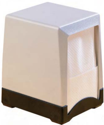
AH 50000 Servilletero de sobremesa. Plástico ABS. 9 x 10,3 x 13,8 cm.