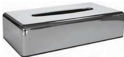
SCEK 10 A Dispensador pañuelos. Cromado. 26 x 14 x 6 cm.